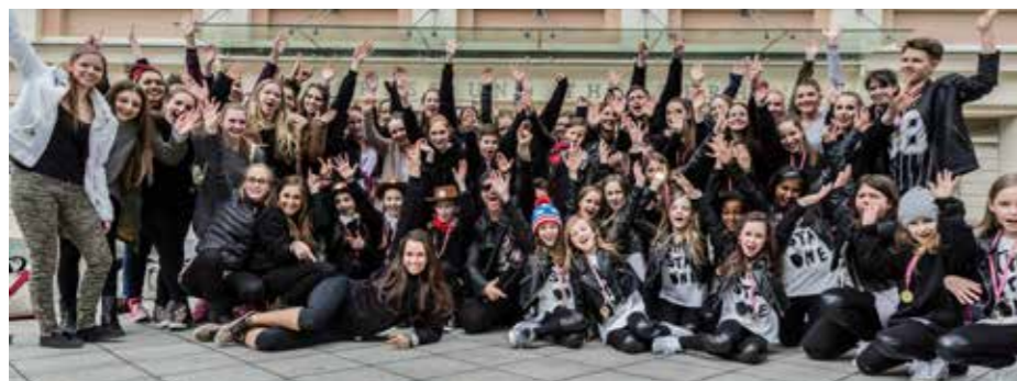
Bad Ischl tanzt