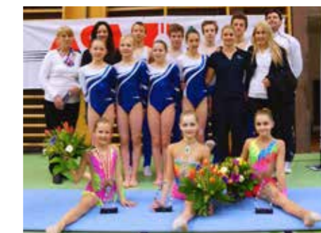
Team Attila Pinter Memorial