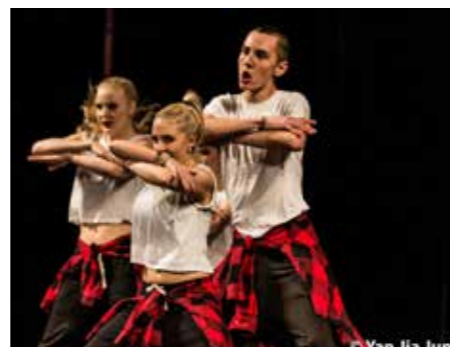
Electric Youth 2