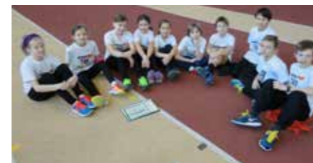
das U12 Team

Ihr wart alle toll! Insgesamt waren 33 ATG-Athleten zwischen 9 und 15 Jahren bei diesen Wettkämpfen. Für viele war es der erste Wettkampf. Gut vorbereitet und mit vollem Einsatz meisterten die Jüngerer die 50 m Hürden, den Sprint über 20m bzw. 30m, den Weitsprung Zone (da werden wir uns noch verbessern!), den Vortex (viele persönliche Bestleistungen) oder das Kugelstoßen für die U14. Als Abschluss gab es den wohl immer wieder spannenden Hindernislauf.