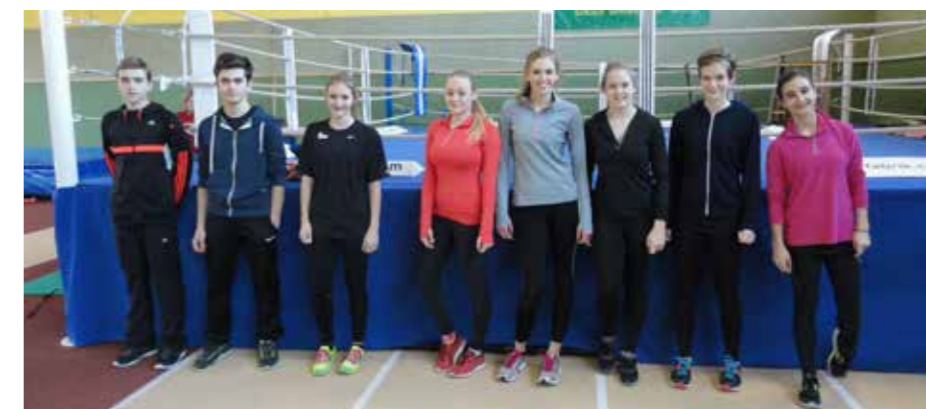
das U16 Team

Ein Dankeschön an die Eltern (und Großeltern) und Euch für die guten Leistungen! Gerhard Ledl