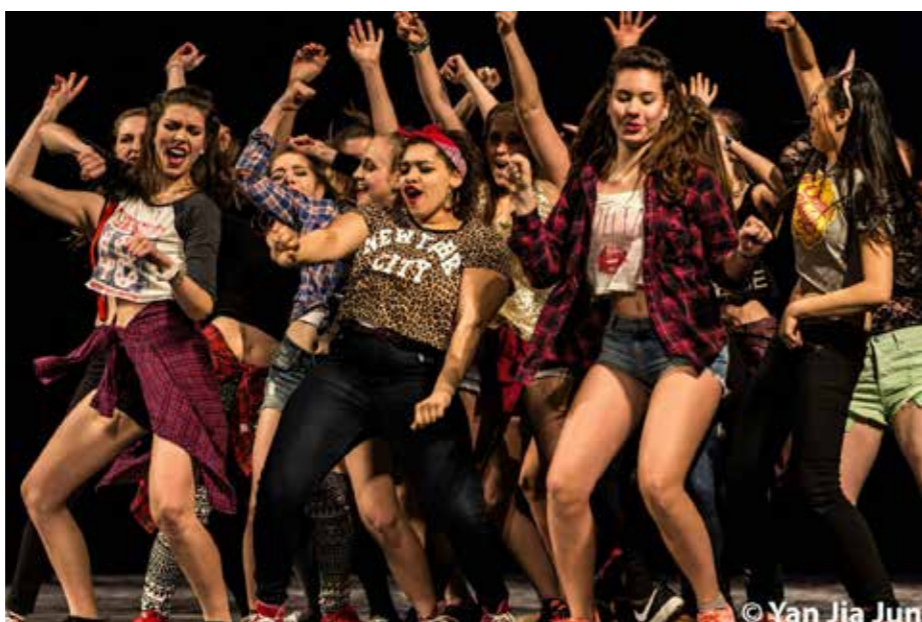
© Yan Jia Jun Miami Heat